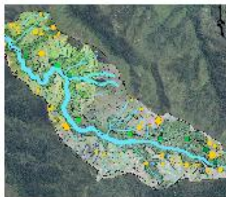
GESTION DURABLE, RESTAURATION DE L'ÉCOSYSTÈME