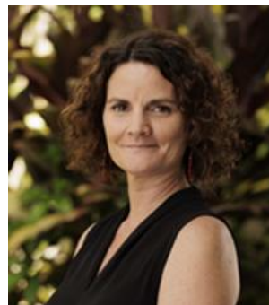
Ambre Eono Santé, Médico-social, Formation et insertion professionnelle Nouméa , Province Nord, Communes du nord