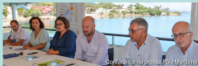
Conférence de presse Pôle Maritime