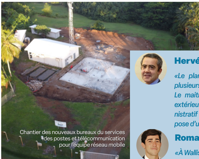
Chantier des nouveaux bureaux des services des postes et télécommunication pour l'équipe réseau mobile

En mai 2021, la Secal a entamé une mission dans le cadre du plan de relance économique de Wallis-et-Futuna, suite à la pandémie. Elle conduit les opérations de projets de construction pour l'extension des locaux de l'Administration supérieure de Wallis et leur mise aux normes énergétiques, le déplacements des bureaux du SPT (Service des Postes et Télécommunications) de Wallis, et la création d'une citée administrative à Futuna. Pour la Secal, il s'agit d'améliorer les infrastructures publiques, notamment en termes de consommation énergétique, de sécuriser l'emplacement des infrastructures par rapport au risque lié à la montée des eaux, et de donner un nouveau souffle à l'économie locale. La fin des travaux est prévue en 2024.