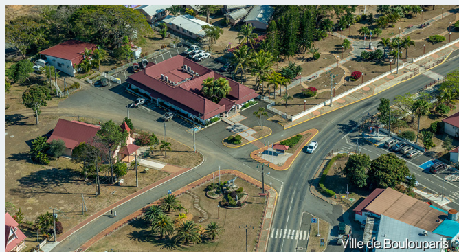
Ville de Boulouparis