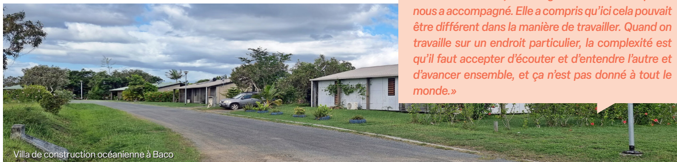
Villa de construction océanienne à Baco

« Ça n'a pas été un parcours aisé, mais il a été très enrichissant. Même si nous n'étions pas avec elle au début, l'avantage de la Secal est qu'elle nous a accompagné. Elle a compris qu'ici cela pouvait être différent dans la manière de travailler. Quand on travaille sur un endroit particulier, la complexité est qu'il faut accepter d'écouter et d'entendre l'autre et d'avancer ensemble, et ça n'est pas donné à tout le monde. »