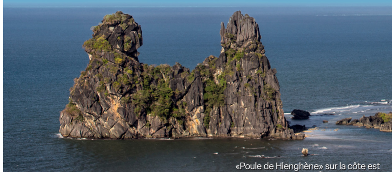
«Poule de Hienghène» sur la côte est

des récifs à l'état sauvage restant sur la planète, se trouvent dans le parc naturel de la mer de Corail.