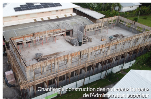
Chantier de construction des nouveaux bureaux de l'Administration supérieure