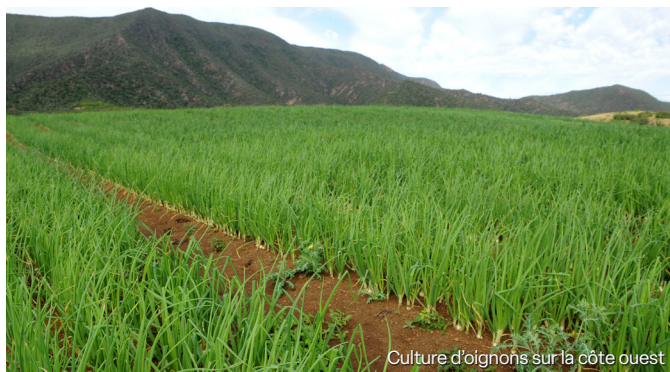
Culture d'oignons sur la côte ouest