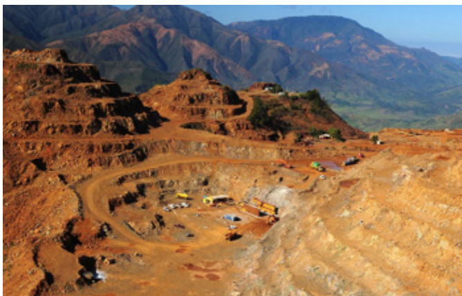
Mine de Thio.