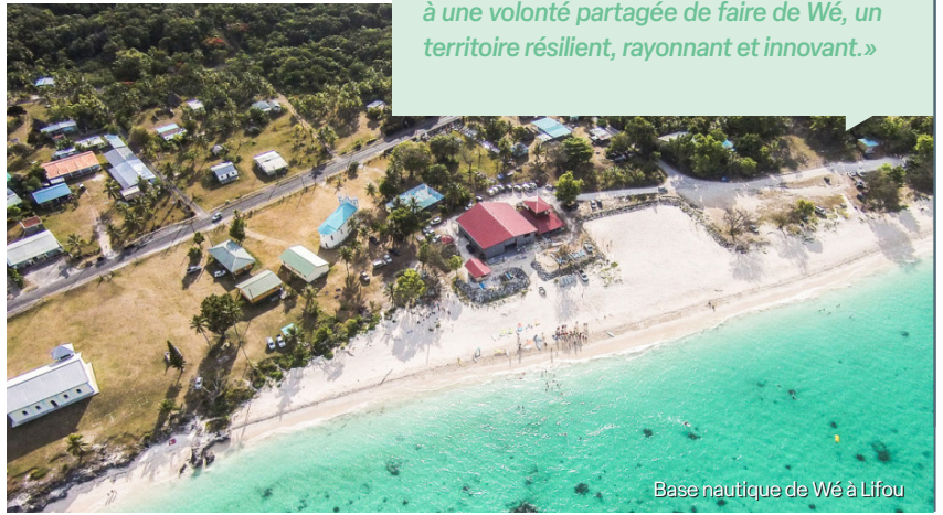
Base nautique de Wé à Lifou

Aux Loyauté où la province a entamé une vaste réflexion sur la refonte de sa politique de l'habitat, la Secal travaille à la promotion et à la planification d'un aménagement durable de Wé , chef-lieu de Lifou, intégrant les problématiques liées au changement climatique. La Secal a ainsi réalisé un schéma d'aménagement concerté et partagé, dont l'objectif est de conforter et de renforcer le tissu économique de Wé . Ce plan doit intégrer les populations et prendre en compte l'impact climatique et l'environnement comme composante essentielle pour un meilleur développement.